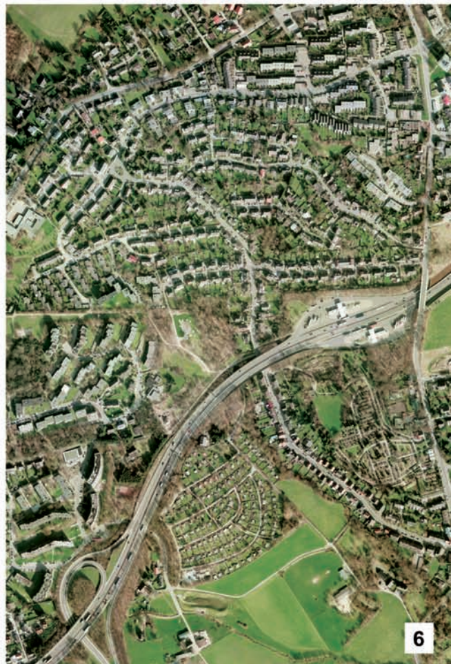
Abb. 3. Ölgemälde von Elberfeld (heute Wuppertal-Elberfeld) vom Kiesberg aus, F. ANDRIESEN, um 1836. – Abb. 4. Aktuelles Foto von Wuppertal-Elberfeld aus dem Jahr 2009 aus vergleichbarer Perspektive, markante Orientierungspunkte sind A: St.-Laurentius-Kirche und B: Die Windmühle (bzw. heute der „Elisenturm“) auf dem Hardtberg. Der Verlauf der Wupper ist rot markiert. – Abb. 5. Luftbild des Heidegebiets an der Schellenbeck im Jahr 1928 (ca. 20 Hektar, oberhalb der Bildmitte, von zahlreichen Pfaden durchzogen). – Abb. 6. Derselbe Bildausschnitt wie in Abb. 5 im Jahre 2007.